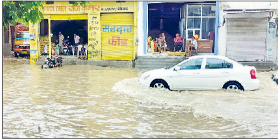
टोहाना। रतिया रोड पर जमा बरसाती पानी।

देर रात को एक बजे फतेहाबाद में मानसून की पहली बारिश हुई तो लोगों के चेहरे पर खुशी लोट आई। सोमवार सुबह आसमान में काली घटाई छाई रही। सुबह करीब 6 बजे से लेकर दोपहर 12 बजे तक बारिश की बूंदें गिरती रहीं लेकिन खुलकर बारिश नहीं हुई। बादल छाये रहने से तापमान में गिरावट दर्ज की गई। सोमवार को अधिकतम तापमान 8 डिग्री सेल्सियस तक गिर गया। यहां अधिकतम तापमान 31 डिग्री सेल्सियस दर्ज किया गया। इसके अलावा जिले के टोहाना, भूना, रतिया, अहरवा, मिरझाना, भोडिया सहित अनेक गांवों में जोरदार बारिश दर्ज की गई। टोहाना शहर में सोमवार को करीबन ढाई घंटे हुई बारिश के चलते मुख्य रास्ते पूरी तरह से जलमग्न हो गए और लोग अपने घरों में दुबकने पर मजबूर हो गए। शहर में करीबन 69 एमएम बारिश दर्ज की गई जिसका पानी करीबन एक घंटे में रोड से निकल पाया। बारिश के चलते