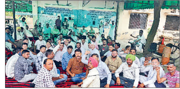
सिरसा। बैठक में सरकार के खिलाफ रोष जाहिर करतेकर्मचारी।

कार्यकर्ताओं ने अपने अपने क्षेत्र में किये जा रहे समाजसेवी कार्यों के बारे में जानकारी दी। इनमें देश विदेश के कई ख्यातिनाम वक्ता भी शामिल हुए। कार्यक्रम का उद्घाटन सिरसा की पूर्व सांसद व भाजपा राष्ट्रीय कार्यकारिणी की सदस्य सुनीता दुग्गल ने किया। दुग्गल ने अपने संबोधन में दिव्या युवा मंच द्वारा किये जा रहे आयोजन की सराहना की। उन्होंने कहा कि अंतरिक्ष के एकमात्र ग्रह केवल पृथ्वी पर ही जीवन संभव है। लेकिन जिस प्रकार से हमारी