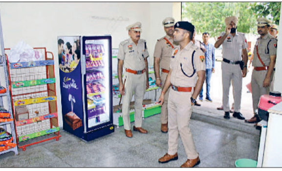
फतेहाबाद। पुलिस लाइन स्थित कैंटीन का निरीक्षण करते एसपी।

जिले में कानून-व्यवस्था को सुदृढ़ बनाने, आपातकालीन परिस्थितियों में त्वरित कार्रवाई की दक्षता बढ़ाने तथा पुलिस बल की तैयारियों का आकलन करने के उद्देश्य से आज पुलिस लाइन फतेहाबाद में जनरल परेड एवं मॉक ड्रिल का आयोजन किया गया। इस कार्यक्रम का नेतृत्व पुलिस अधीक्षक सिद्धांत जैन ने किया। एस्पपी ने परेड का निरीक्षण कर उपस्थित पुलिस बल की