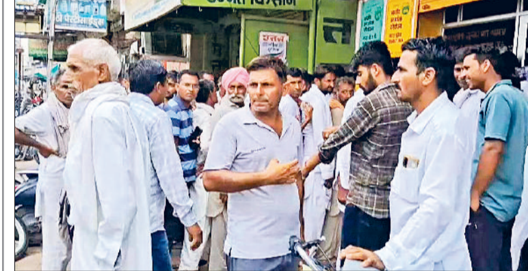
सिरसा। खाद वितरण केंद्र पर खाद लेने पहुंचे किसान तथा मौके पर तैनात पुलिसकर्मी।