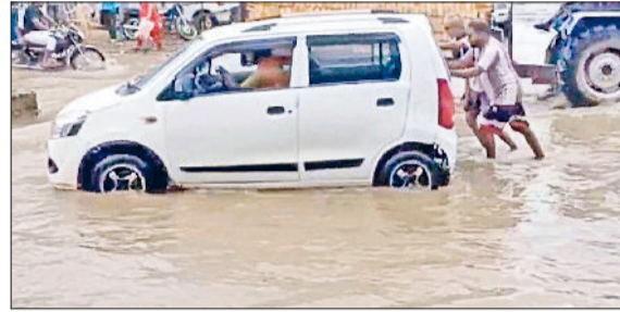
टोहाना। बरसात में बंद गाड़ी को धक्का मारते हुए राहगीर।