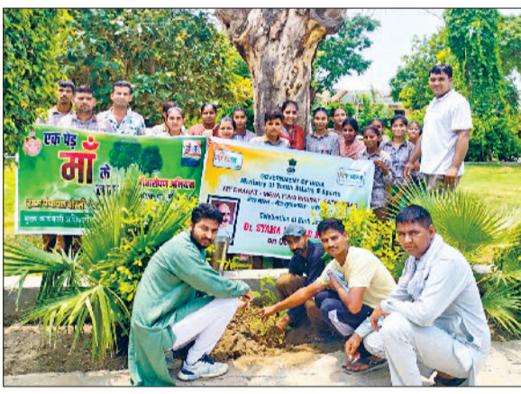
भूना। राजकीय वरिष्ठ माध्यमिक विद्यालय में पौधरोपण करते विद्यार्थी व अन्य।